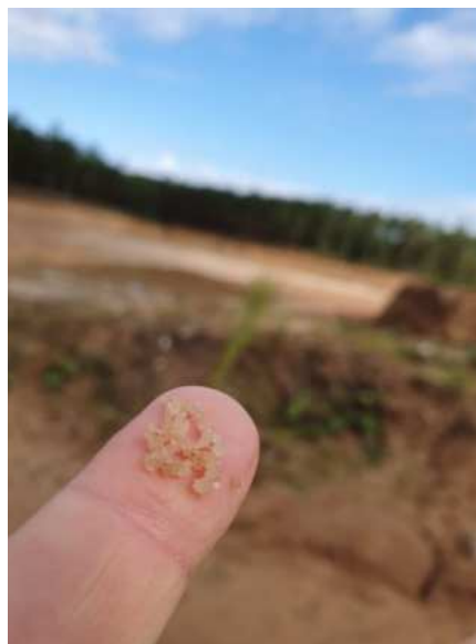
Abbildung 2: Sandkörner

unweigerlich zerstört. Beim unkontrollierten Abbau des kostbaren Meeres- oder Flussandes wird das Bodensubstrat zerstört und Sediment aufgewirbelt, welches sich als Trübung des Wassers bemerkbar macht (6) . Durch weniger einfallendes Licht kommt es daraufhin zur Beeinträchtigung der Ökosysteme. Zudem leiden Küstenbereiche immens unter dem Absaugen des Rohstoffs. Sie verschwinden regelrecht unsichtbar in den Bäuchen der absaugenden Schiffe. Dadurch ergibt sich mehr Angriffsfläche für Wellen und es entsteht eine Abwärtsspirale, bis die Küstenlinie nicht mehr vorhanden ist. Ebenso geht es ganzen Inseln und Archipelen. Laut Schätzungen sind mittlerweile weltweit zwischen 75-90 Prozent der Strände auf dem Rückzug (7) .