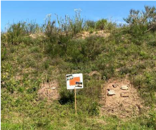
Abbildung 1: Sandarium für Wildbienen und Co.

unter die Lupe genommen. Hier wurde mit Hilfe eines Experten der Fokus auf die spezialisierte Tier- und Pflanzenwelt gelegt. Zudem wurde Raum für kontrovers diskutierte Themen, wie den Sandabbau, geben.